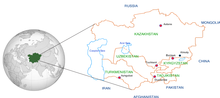
Рисунок 1. Географическое расположение Центральной Азии

Регион «Центральная Азия» расположен в центре Евразийского континента и включает 5 стран: Республику Казахстан, Кыргызскую Республику, Республику Таджикистан, Туркменистан и Республику Узбекистан (рисунок 1).